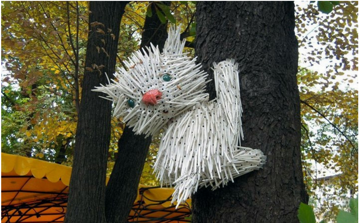
Фото опубліковано із дозволу скульптора Костянтина Скрытуцького