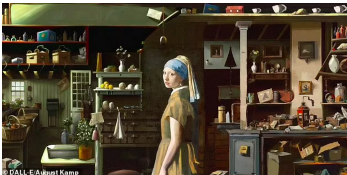
Ян Вермеєр «Дівчина з перловою сережкою»