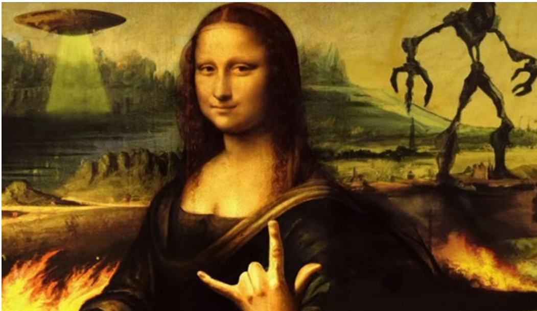
Леонардо да Вінчі «Мона Ліза» https://dev.ua/news/dall-e-1662616405